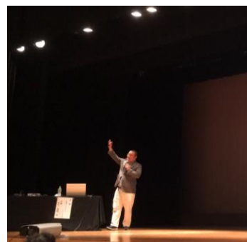
3密を避けるため、文化センターの大ホールで開催しました。（ソーシャルディスタンスを確保しているので演者はマスクを外しています）

奈義ファミリークリニックは皆さまの健康を見守っています。ご心配なことがありましたらお気軽にご相談くださいね。