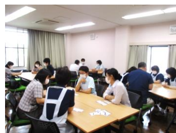
グループに分かれて、カードとらめっこ。自分が大事と考えるキーワードを吟味しています。

「もしバナゲーム™」というカードゲームをスタッフで行いました。 “人生の最期にどう在りたいか”を考えるきっかけになるゲームです。 キーワードが書かれたカードを交換しながら自分が優先したい事柄を絞っていきます。2回目は違う結果になるパターンもあるようです。 「縁起でもないこと」を前もって話す、考える、他者の考えを聞くことで、自分自身の思いに初めて気づくこともあります。結果に納得したり、なんとなく腑に落ちなかったり…「もしも」の話だから気軽に（でも真剣に）重たいテーマに向き合える、貴重な時間となりました。