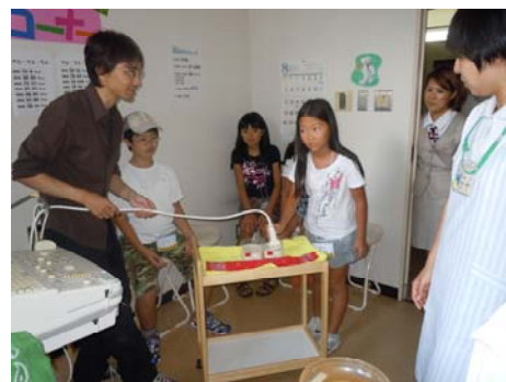
エコーの機械を使って寒天の中に何が入っているか当ててみました。