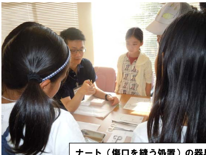
ナート(傷口を縫う処置)の器具を使ってみました。先生が器具の説明をしてくださいました。

色々な体験を通して、お医者さんやクリニックのこと、医療について学んでもらえたと思います。クリニックを身近に感じてもらえたら、嬉しいです。