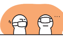
ただしくマスクをつけよう