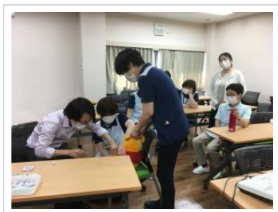
📷 ワクチン接種の実演風景

クリニックではこれからもお子様の苦痛をできるだけ和らげる工夫をしながら、ワクチン接種に取り組んでいきたいと考えています。